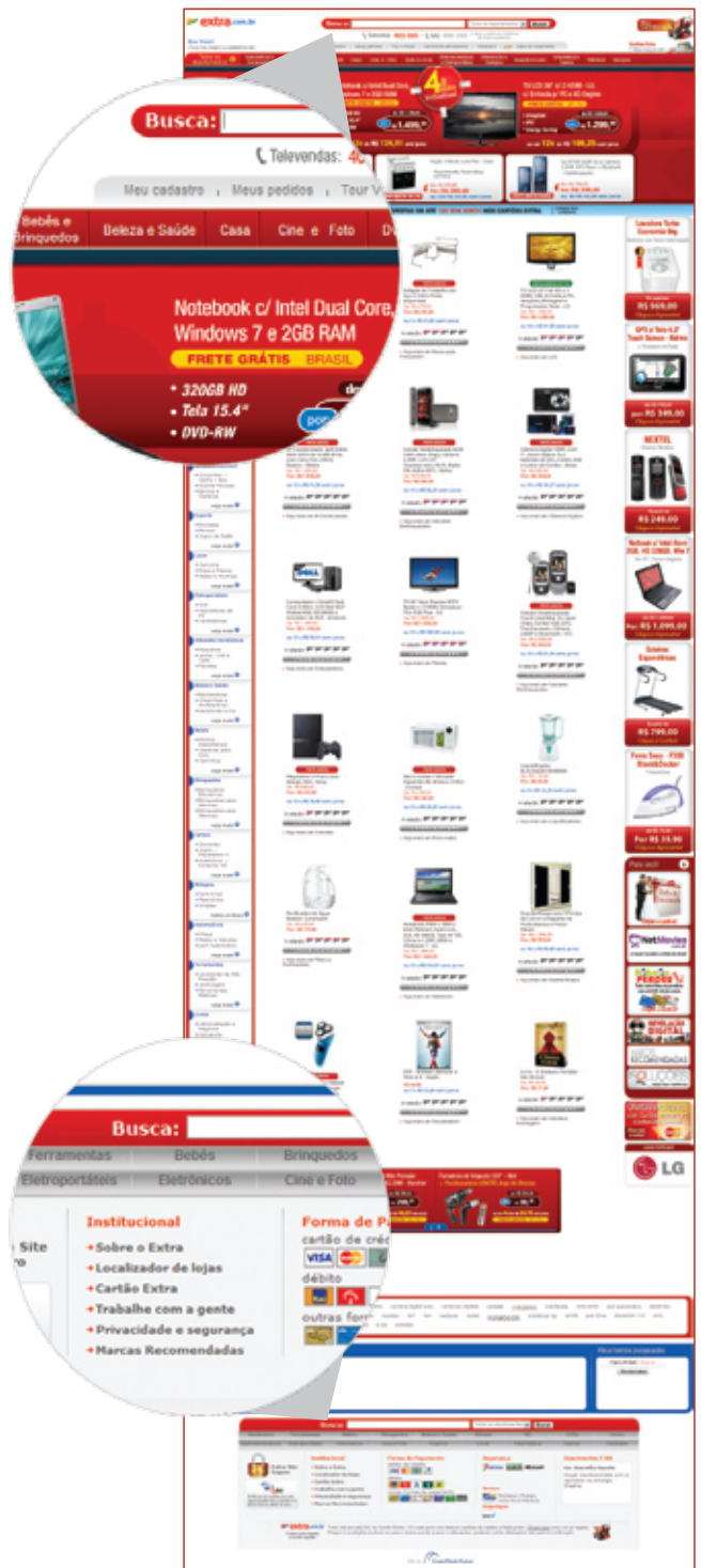
Campos de busca no topo e no rodapé do site

TI: O menu atual está mais curto e as categorias foram agrupadas de outra forma. Pode nos contar como